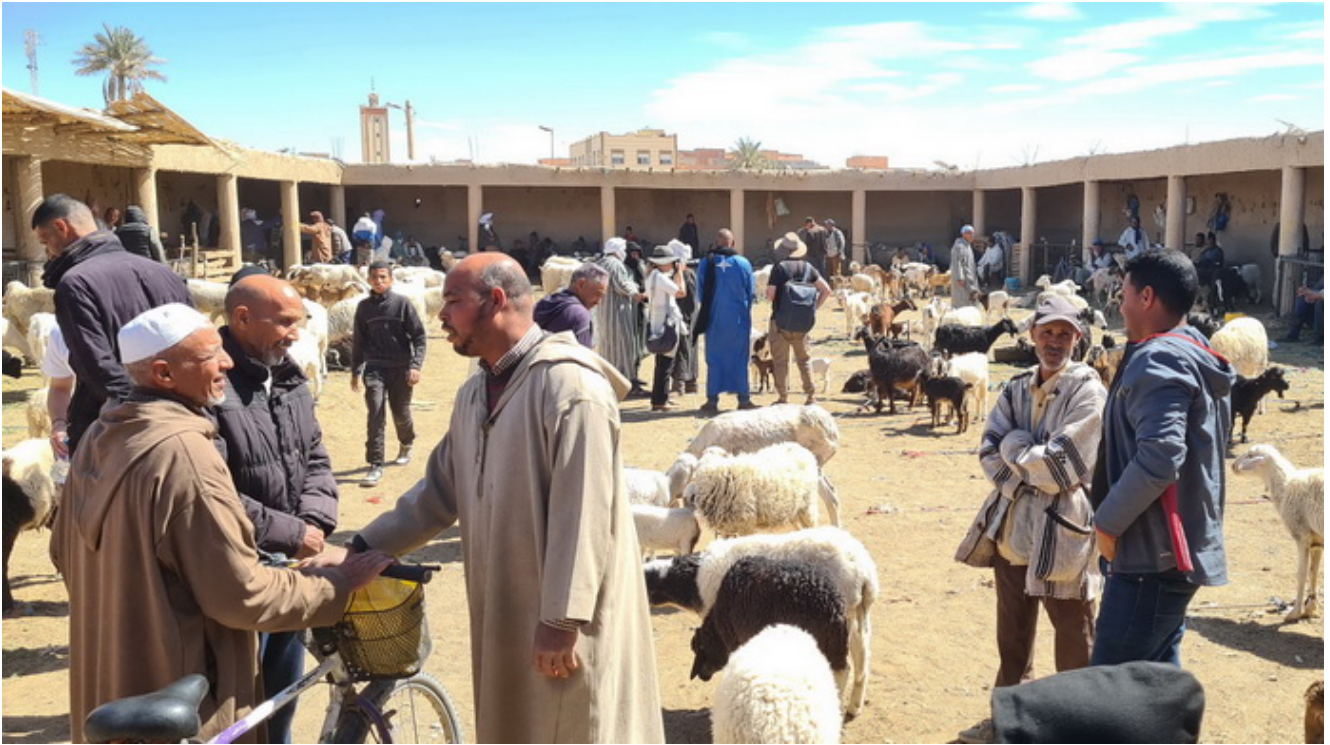
Mercado de cabras