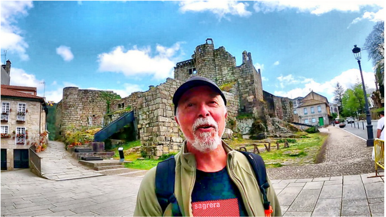
Castillo de Ribadavia

Recuerda fijar cuando se ha de sincronizar tu aparato a la nube y copiarlo todo o lo que haya cambiado.