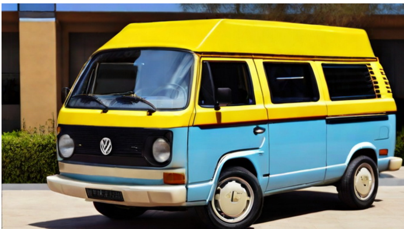
Furgoneta camper azul y amarilla

En cuanto a más mejoras en la vida Camper ya he hablado de infraestructuras, el vehículo, como soslayar los robos, las apps, el día a día y hoy voy a hablar de viajar seguro en Camper.