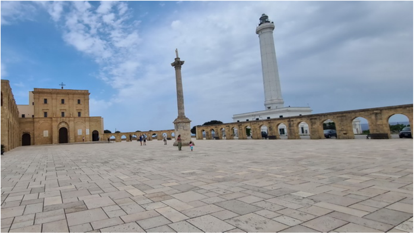
Basílica de Santa Maria de Finibus Terrae