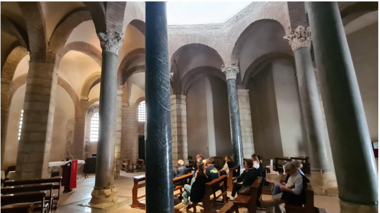
Iglesia redonda de Santa Sofia en Benevent

Este Camino pasa por lugares de significancia espiritual que vale la pena conocer y podemos destacar el Monte Gargano que, aunque supone un pequeño desvío de la ruta más corta vale la pena.