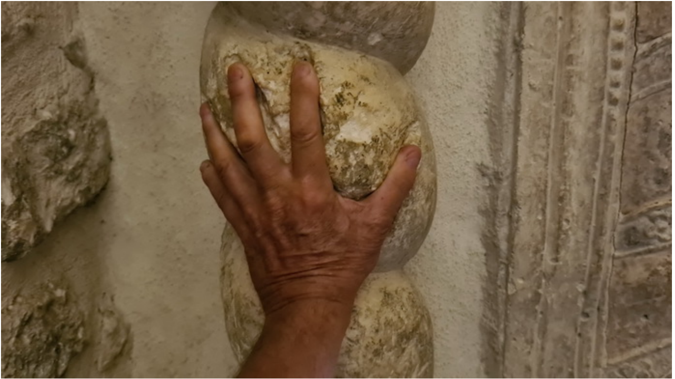
Huella peregrina izquierda en San Michele