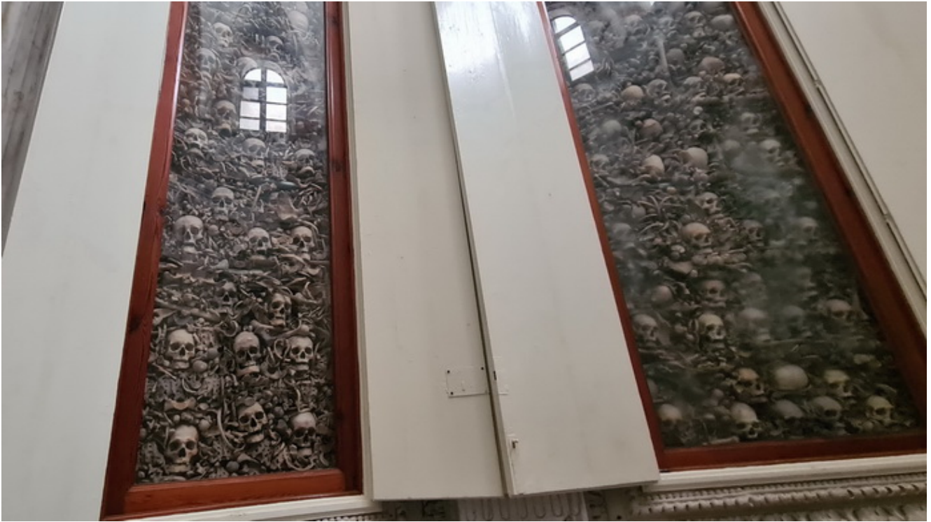
Fin de la Via Trajana en Brindisi