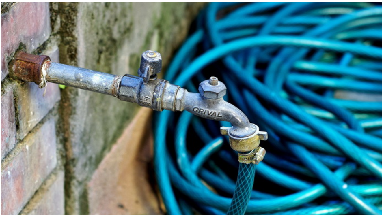
Manguera de agua

Si eres de los que se meten en lugares difíciles de los que pueden tener que rescatarte una cincha de arrastre de más de 4mil kg, los enganches correspondientes, unos guantes adecuados al manejo de estos elementos y unas planchas de desatasco han de entrar en tus necesidades.