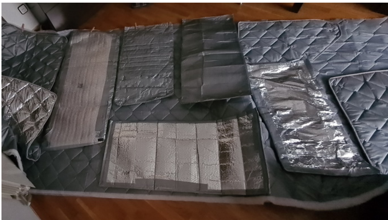
Fabricación de escurecedores

Llevo escoba y aspiradora que por lo inevitable de ensuciar continuamente el suelo uso también continuamente.