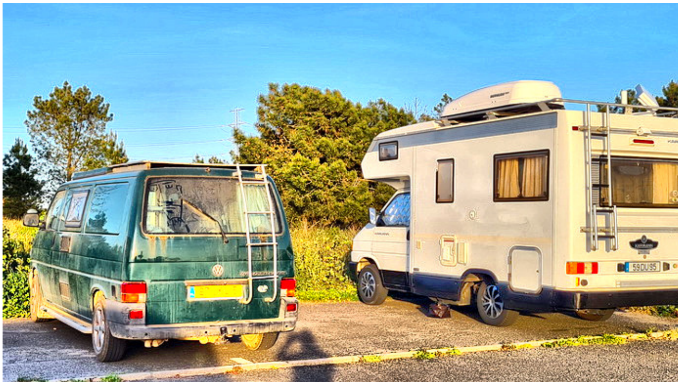
Camper T4 verde

Mejora del Camper significa mejorar tu vida en este tipo de vivienda. Ser más feliz y ganar en calidad de vida. Aunque todos podemos cambiar continuamente de opinión cada cual tiene unas preferencias y por ahí vamos a empezar.