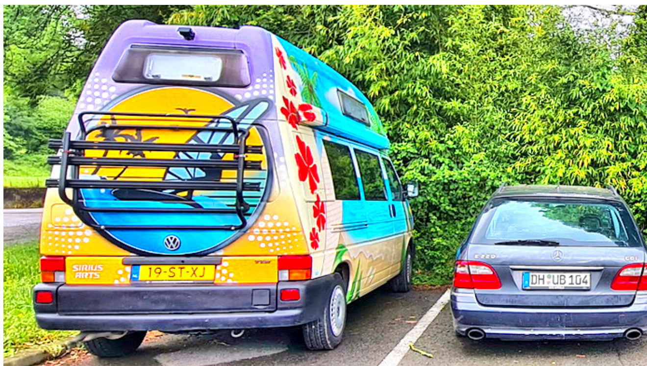
Camper de fantasia

Cuando no pude viajar a pie escogí un vehículo que tenía unas dimensiones reducidas, nevera, calefacción, cocina, pero no tenía una cama fija, ducha fija, wc fijo. He escrito al respecto de la Volkswagen California T4. También he hecho alguna mejora del Camper que comentaré.