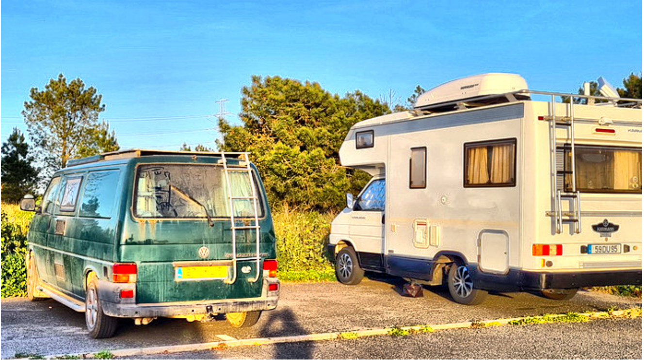
Camper T4 verde

Mejora del Camper significa mejorar tu vida en este tipo de vivienda. Ser más feliz y ganar en calidad de vida. Aunque todos podemos cambiar continuamente de opinión cada cual tiene unas preferencias y por ahí vamos a empezar.