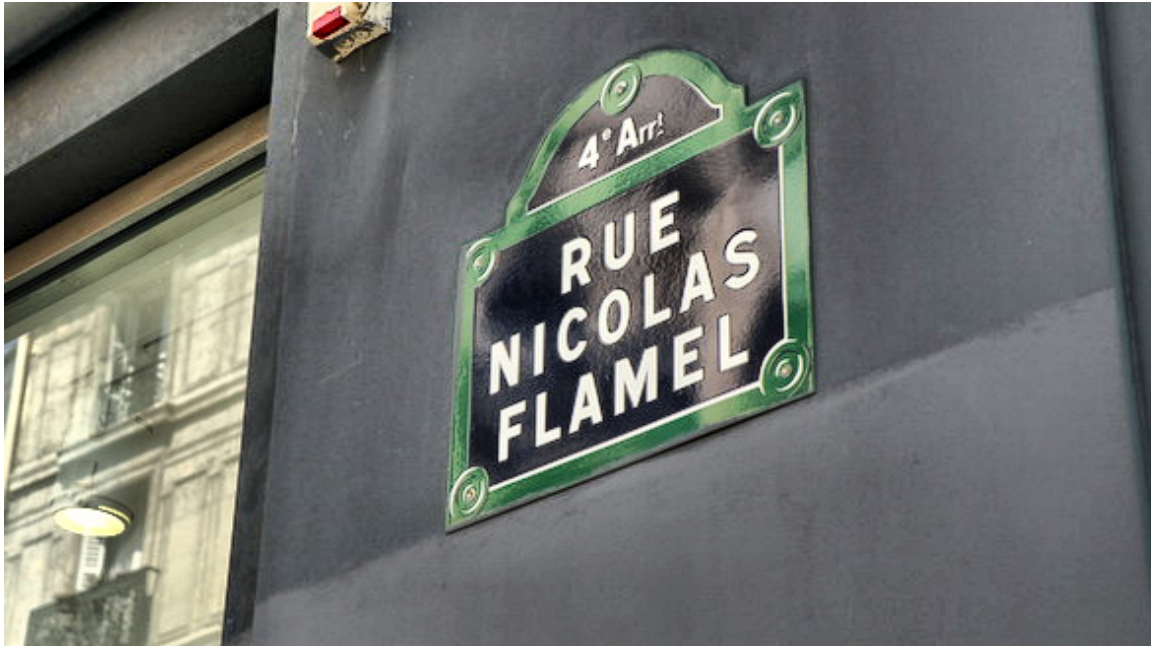
Rue de Nicolas Flamel