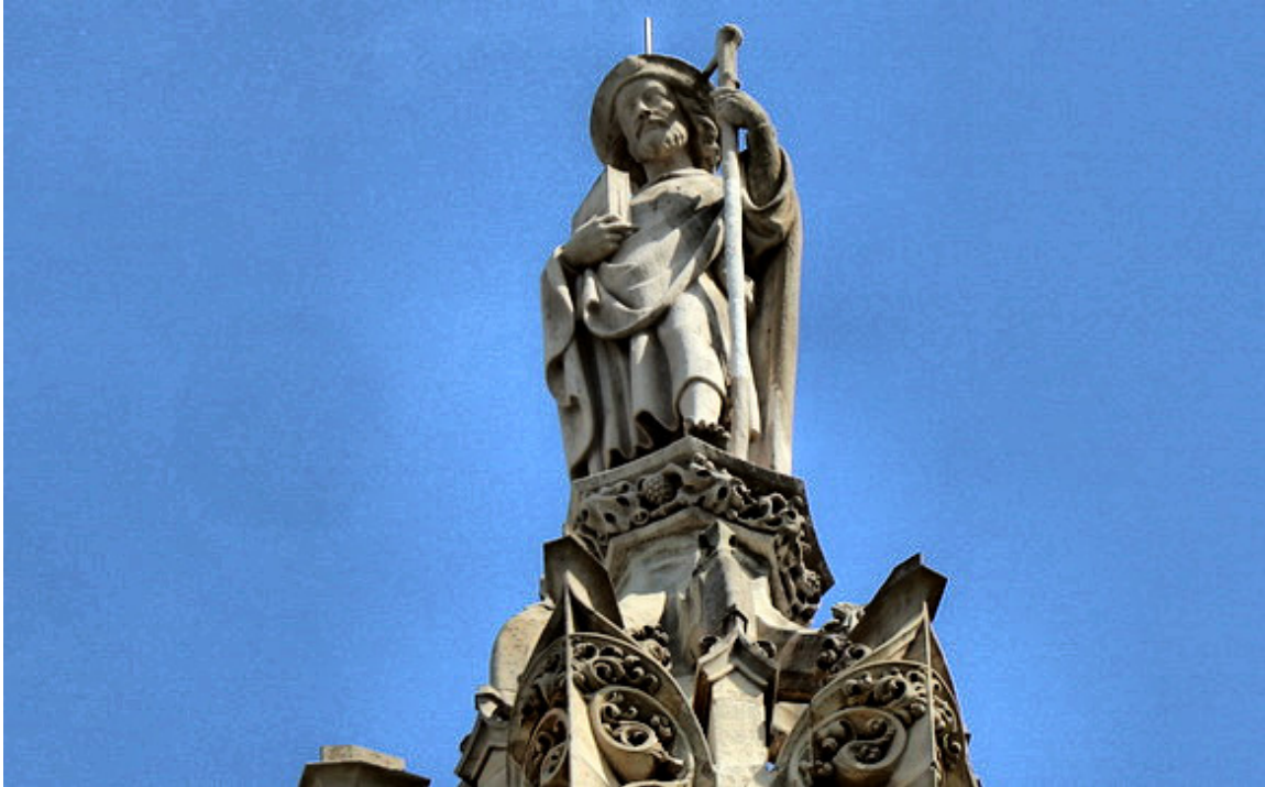
Saint Jacques en la Tour

Sobre la enorme torre una estatua de Santiago con un libro cerrado. Los secretos bien guardados, aquí no te van a revelar nada.