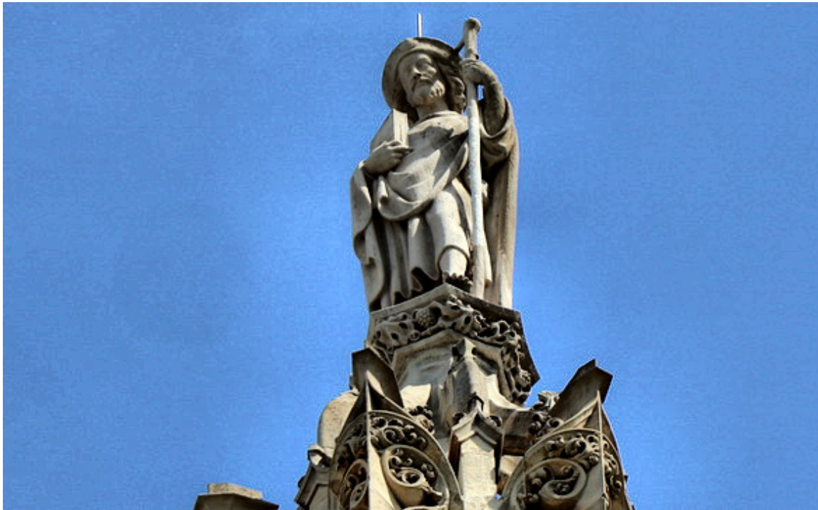
Saint Jacques en la Tour

Sobre la enorme torre una estatua de Santiago con un libro cerrado. Los secretos bien guardados, aquí no te van a revelar nada.