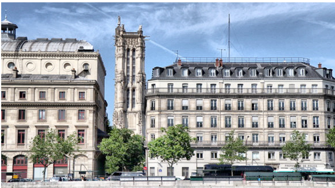
Toda la Tour de Saint Jacques

De la enorme iglesia de Santiago de Paris solo queda la torre. Dicen que la salvó de la destrucción un fabricante de balas de plomo ya que en lanzar por un artefacto plomo fundido desde arriba llegaban al suelo bolas perfectas.