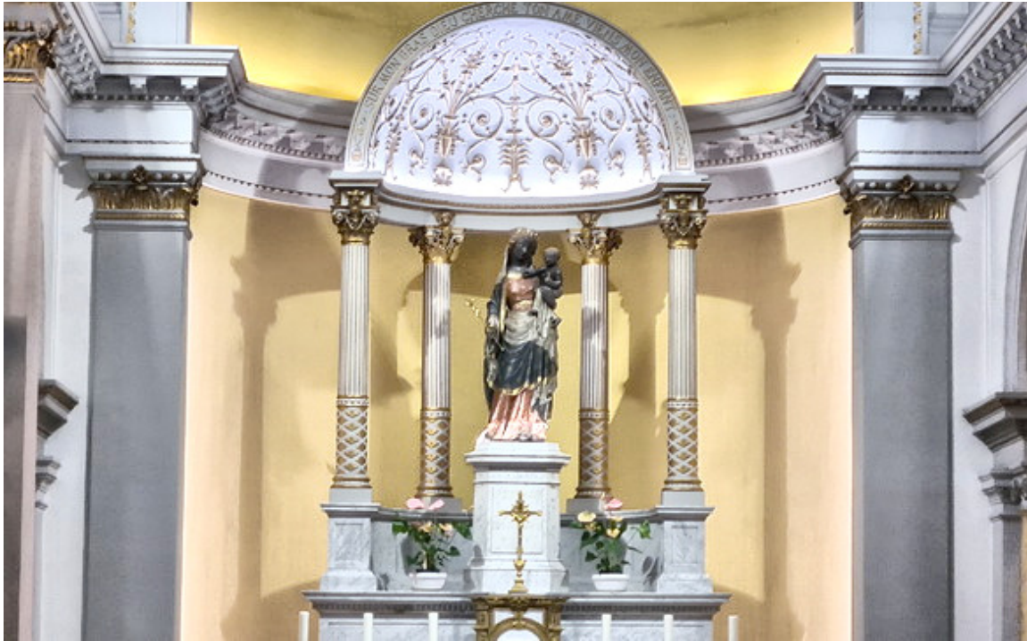
Capilla de Notre Dame de Bonne Deliverance