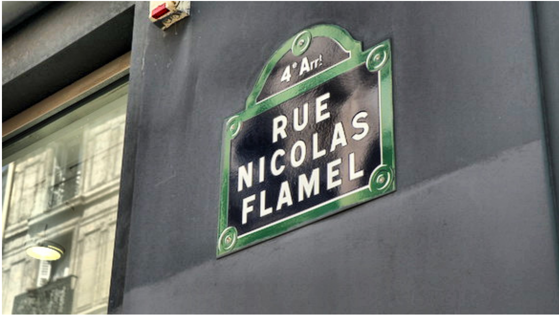
Rue de Nicolas Flamel