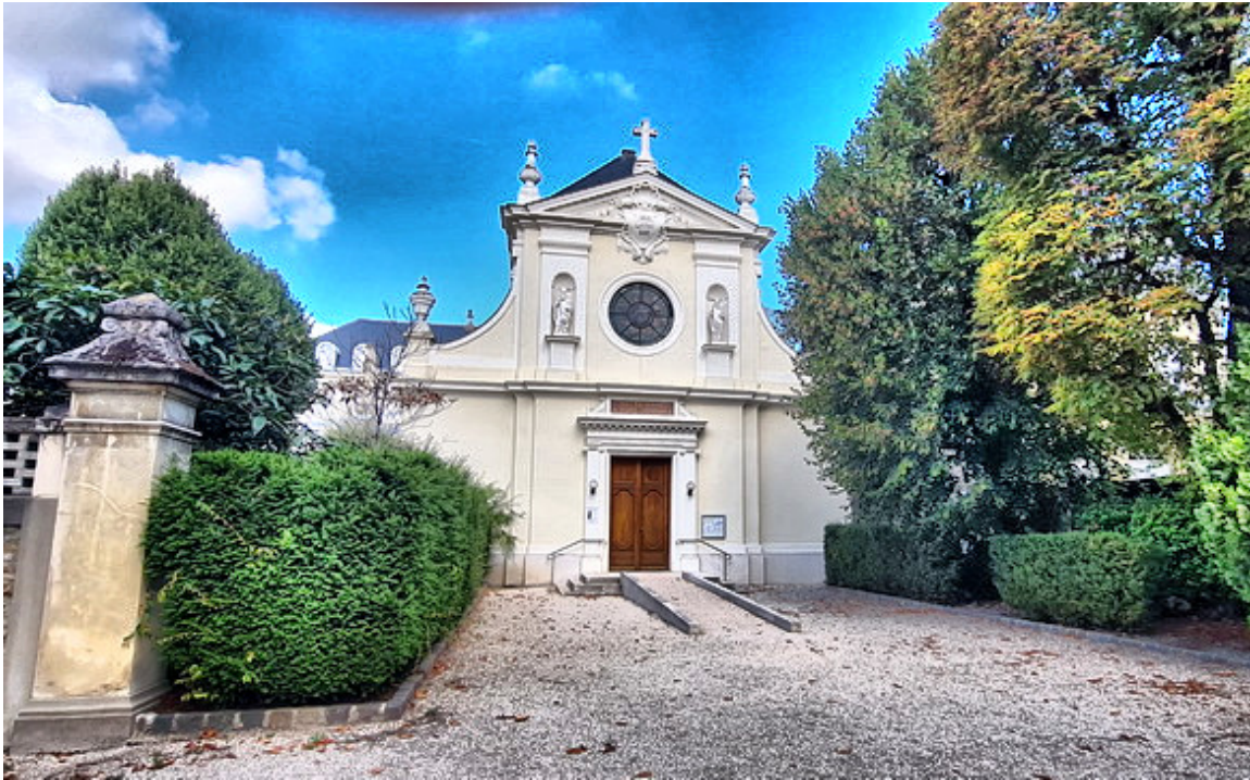
Exterior Bonne Deliverance

Has de coger la línea uno del metro (desde Chatelet, si es que estas en la Tour de Saint Jacques) hasta la parada del puente de Neully y desde allí caminar diez minutos hasta la Chapelle Notre-Dame de Bonne Deliverance.