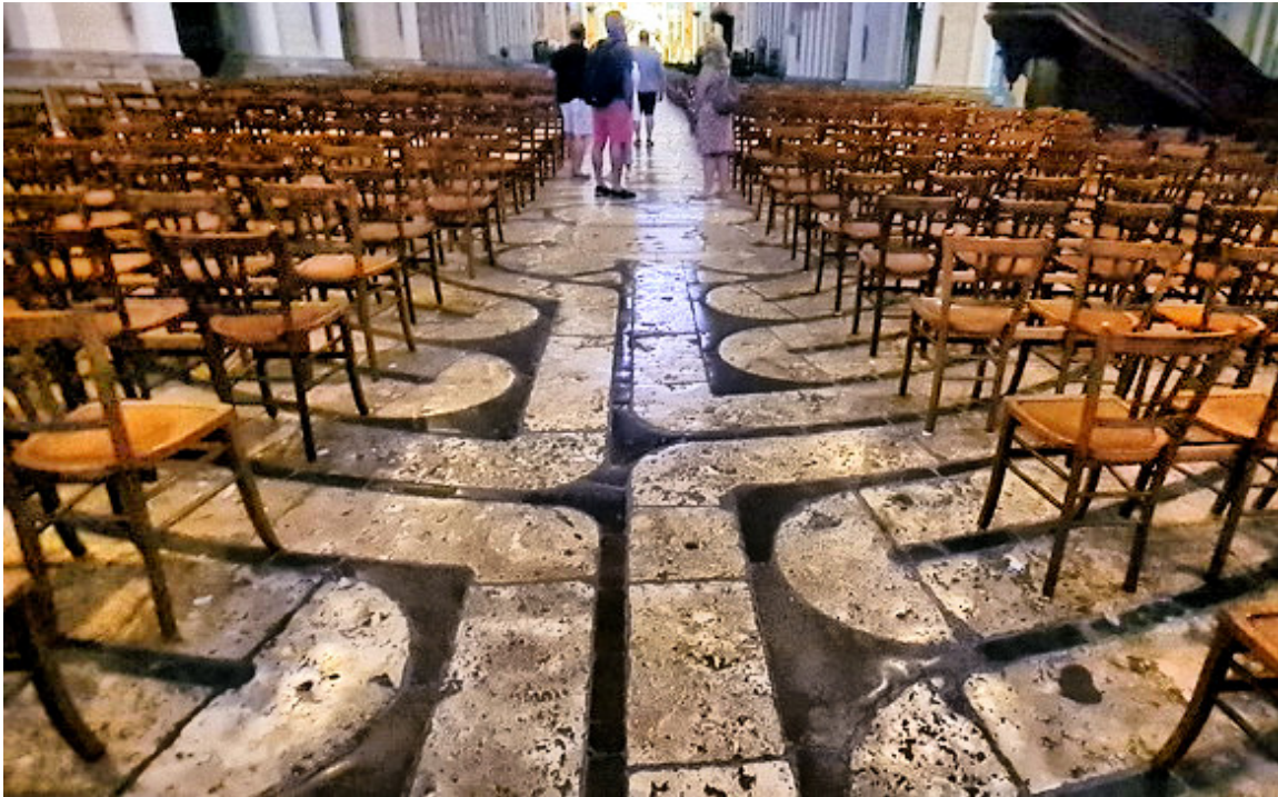
Laberinto de Chartres

Las preguntas son muchas y las respuestas están a la vista. No las has de pensar ya que tú mismo las sentirás.