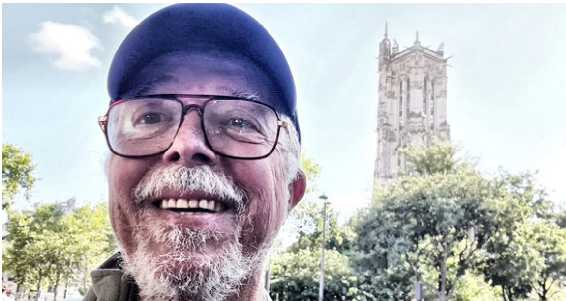
En la Tour de Saint Jacques de París

Pero ya sabes que generalmente bajo una leyenda haberlo, haylo.