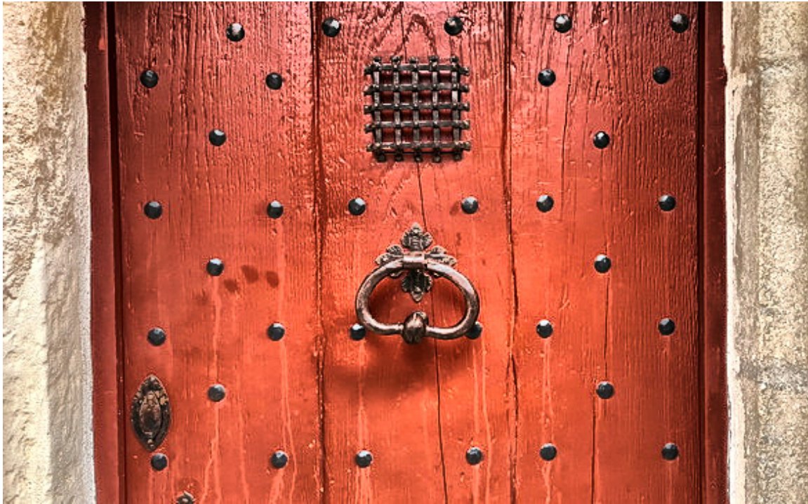
Llamador de puerta