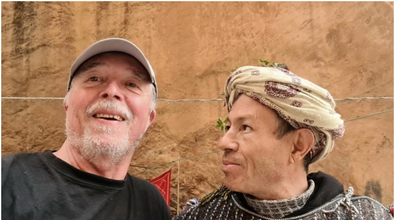
Selfi con amigo

Ver: Plaza de las fuentes (compra pan), callejón El Asri, callejón azul, callejón Sidi Bouchouka, Rue Ibn Asskar, atardecer desde la mezquita española. Pasear y acabar tomando un té en la plaza de las fuentes, en el Ali Baba por ejemplo.