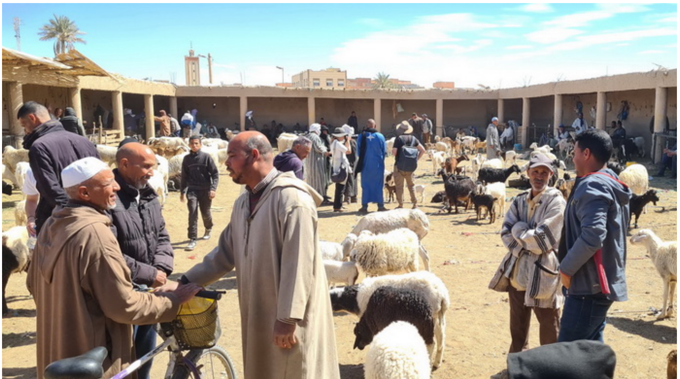
Mercado de cabras

Ir con algun amigo también es genial solo que será bueno estar en contacto mediante walkie-talkies que puedes encontrar en amazon por ejemplo desde 30€