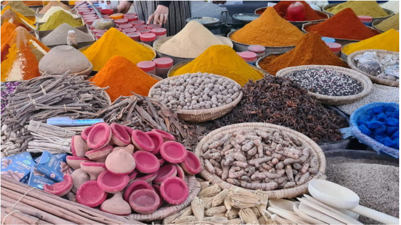
Mercado de especias