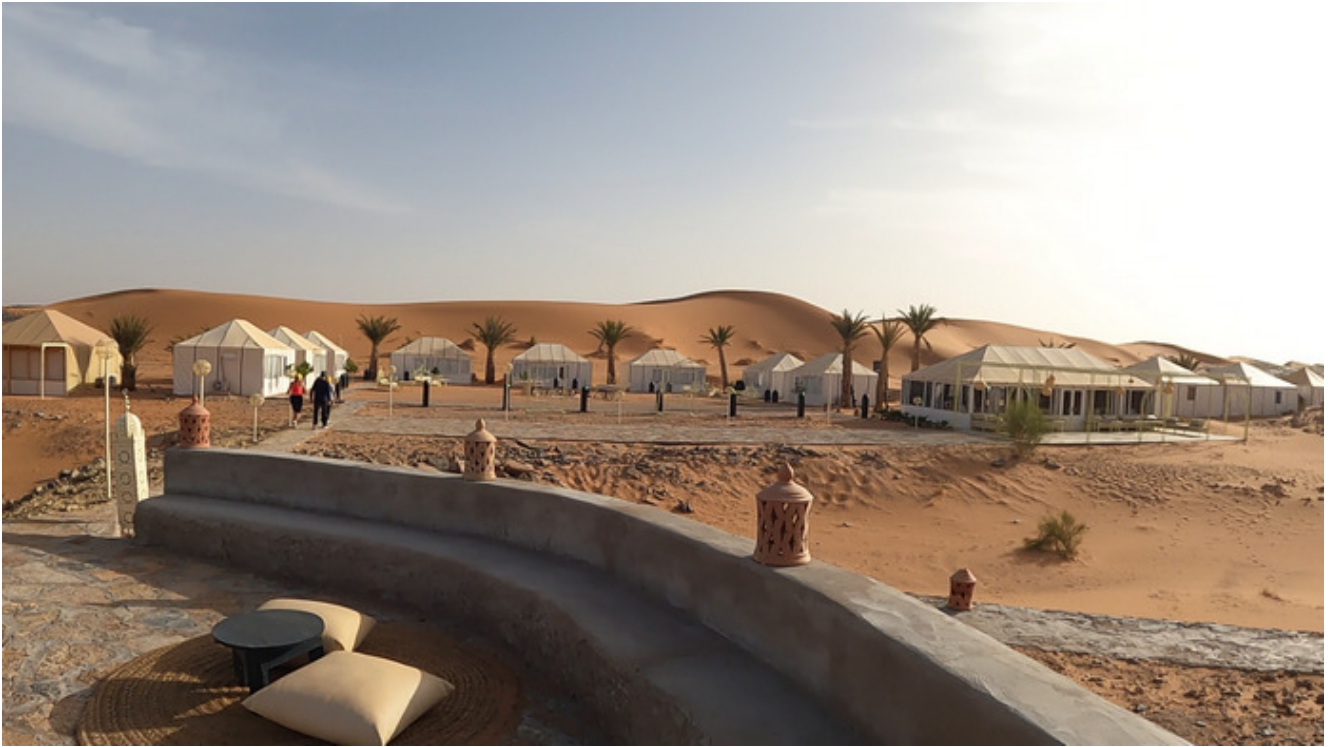
Desde el mirador de la Haima

Busca haima u hotel con Booking o con Turismo de Marruecos por ejemplo y concreta los lujos que te digo que te costarán bien poca pasta. Por ejemplo una buena haima es la Itran Royal Camp, búscala con google maps.