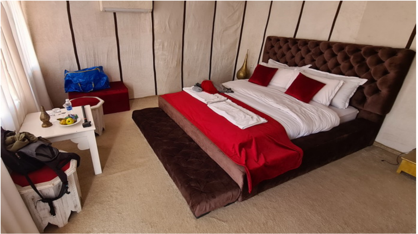
Una haima en el desierto

En mi primer viaje, el de la agencia novata, intentaron mantener como algo secreto como era la noche en el desierto. Daban a entender que íbamos a dormir casi como en vivacs o en tiendas de campaña. Para sorprender al personal con un hospedaje en tiendas enormes, que son habitaciones individuales con camas de casi un par de metros de ancho y también dos de largo, baño en cada tienda, aire acondicionado y calefacción. Es decir hospedaje de cinco estrellas lo que epata al personal. Sin Código Postal no hizo jugarretas y desde el principio supimos como era el hospedaje. Es decir las dos veces que he dormido en el desierto ha sido en Haima.