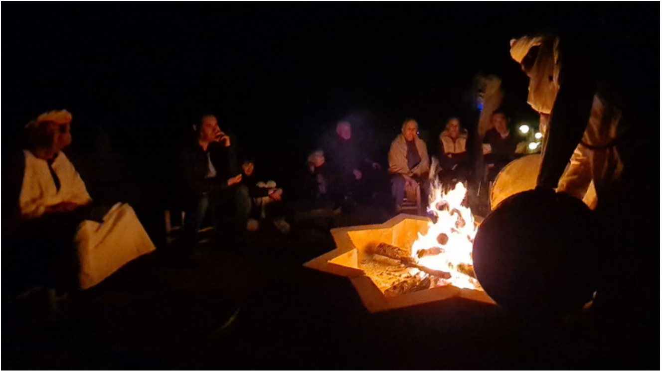
La magia del fuego