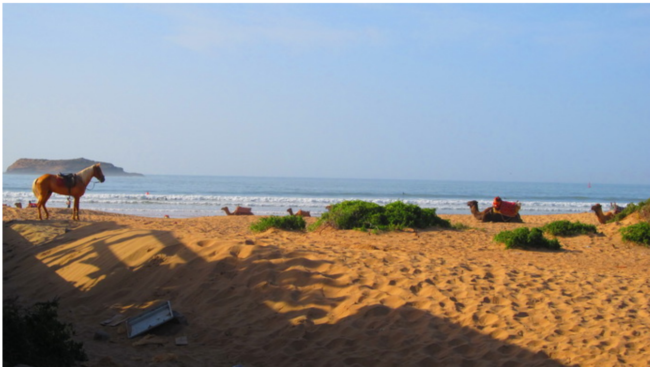
Caballos y Dromedarios en la playa

Pasado Safi, algo lejos, hay un camping #69937.