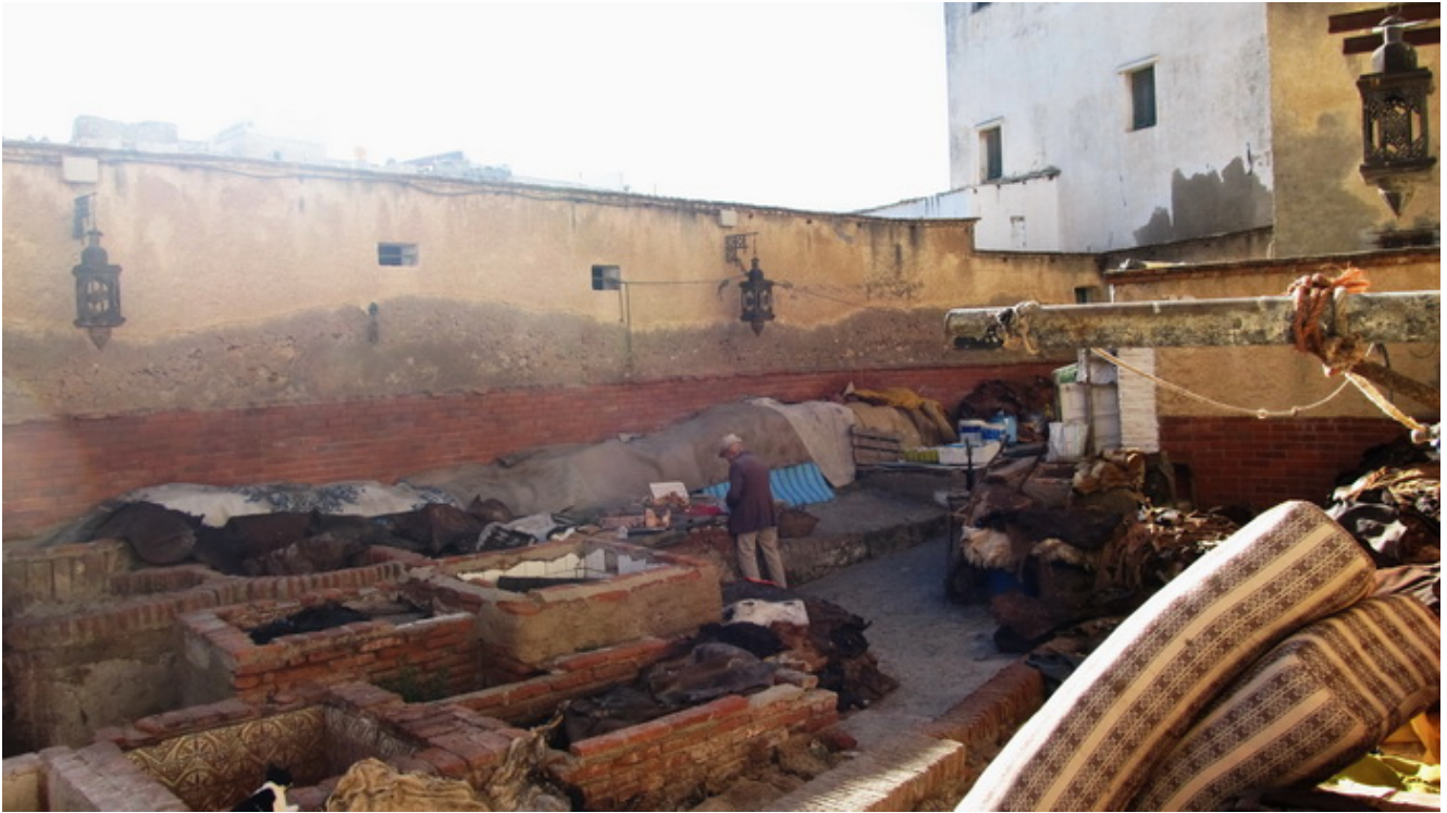
Tenerias en Tetuan