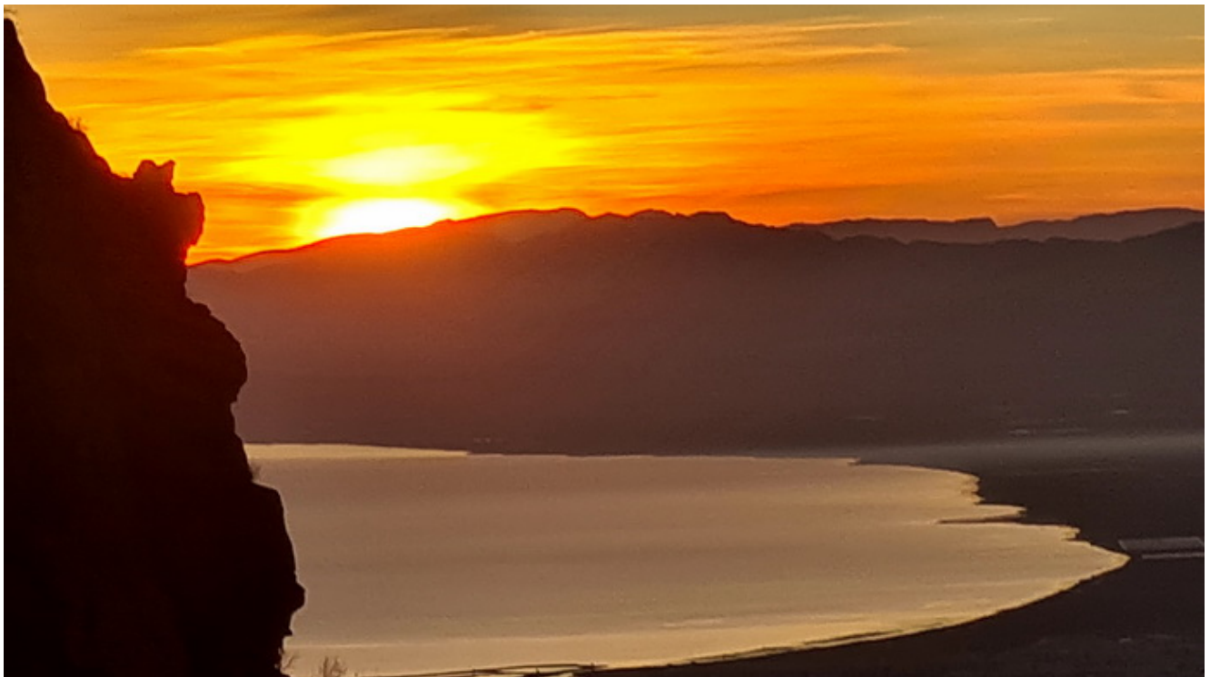
Amanece en el monte Gurugu