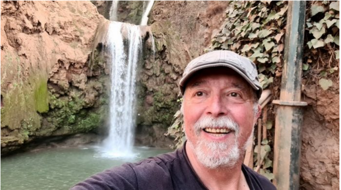
Cascadas de Ouzoud