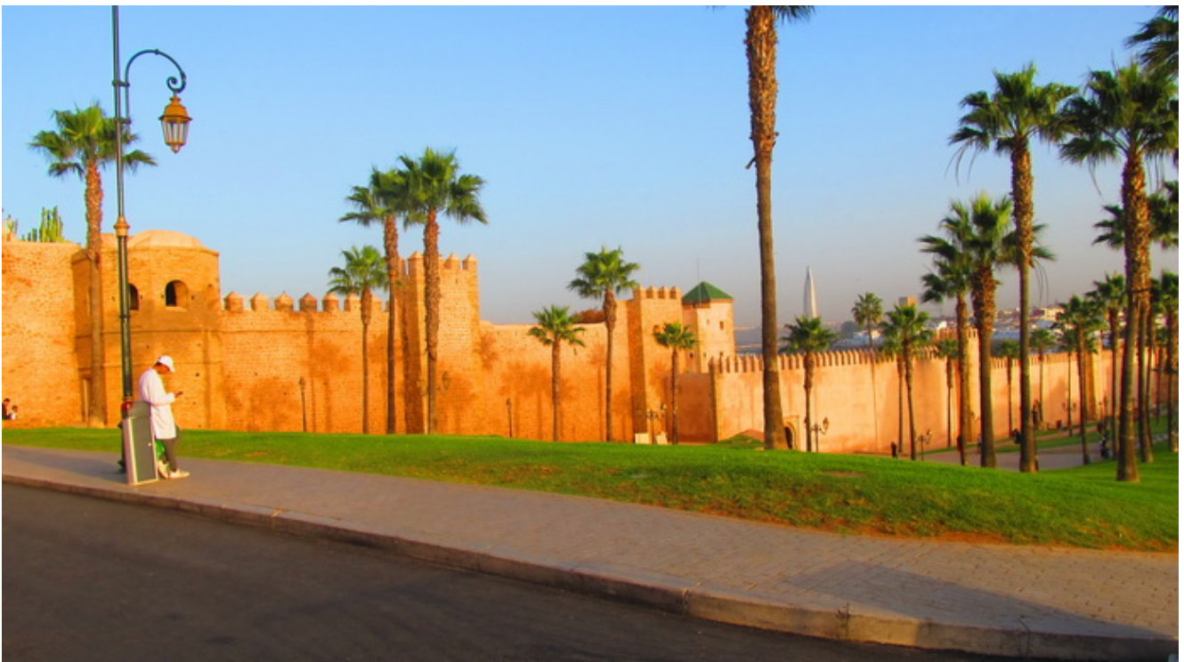
Rabat y sus murallas

Restaurantes, muchos, es una ciudad de turistas y playas, por decir alguno, Casa García, Océano Casa Pepe, Dar Al Mahgrebia y Ali Baba.