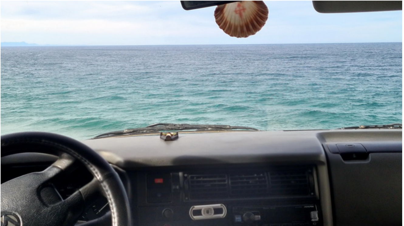
Una vista del mar desde la camper

Espero que esta pequeña guía te ofrezca ayuda en tu viaje a este maravilloso país.