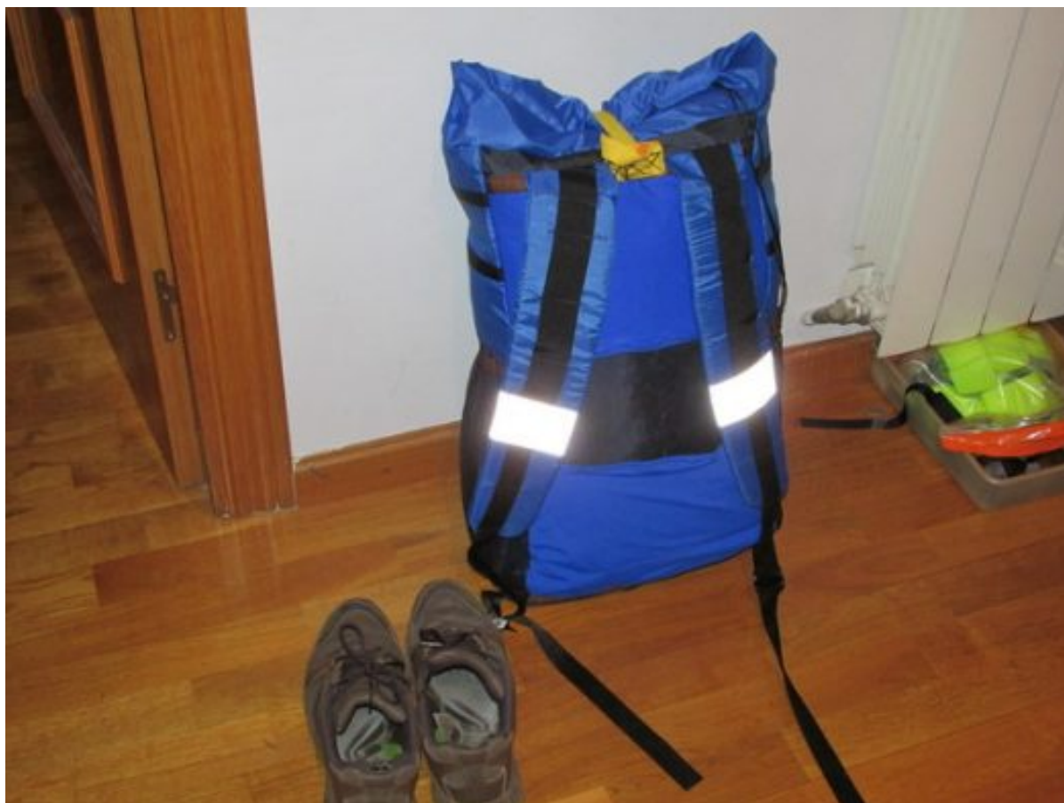
Una bolsa de paseo