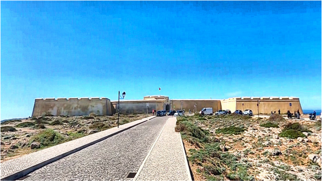
San Vicente Castillo