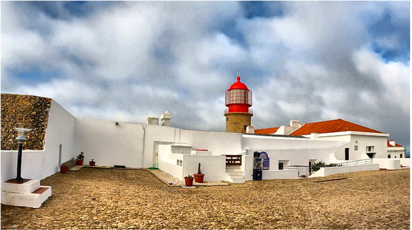
El Faro del Cabo San Vicente