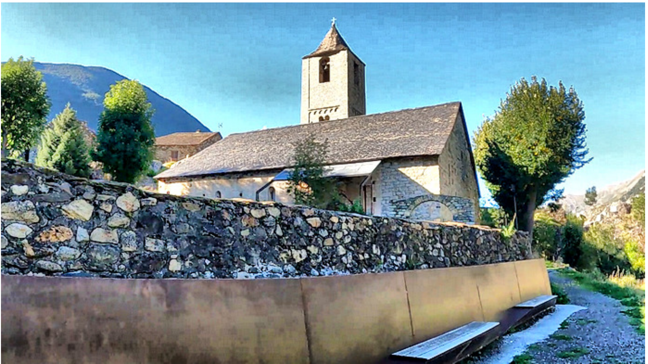
Sant Joan PK

Assumpció de Còlll tiene la mejor portalada de todas, el crismón, los capiteles que están esculpidos con motivos vegetales, animales y con figuras humanas.