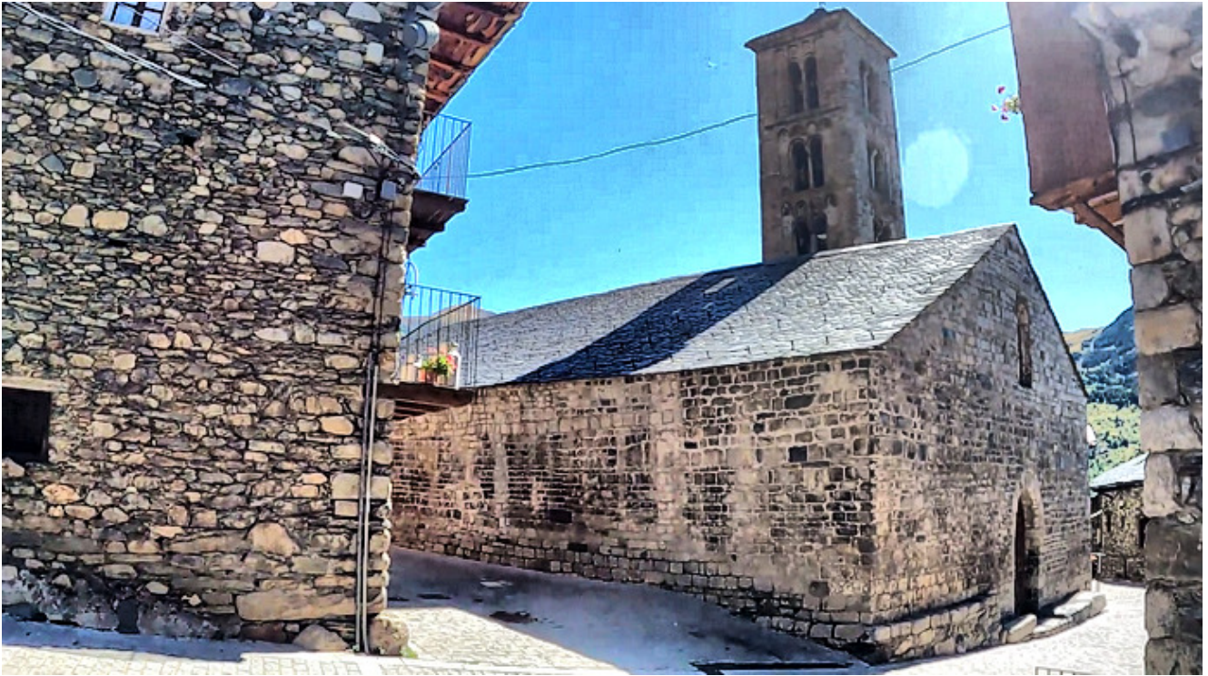
Santa Maria ext