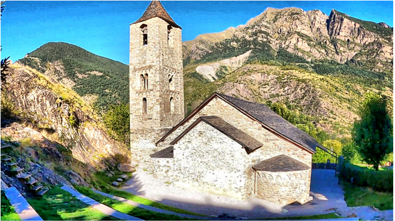
Sant Joan ext